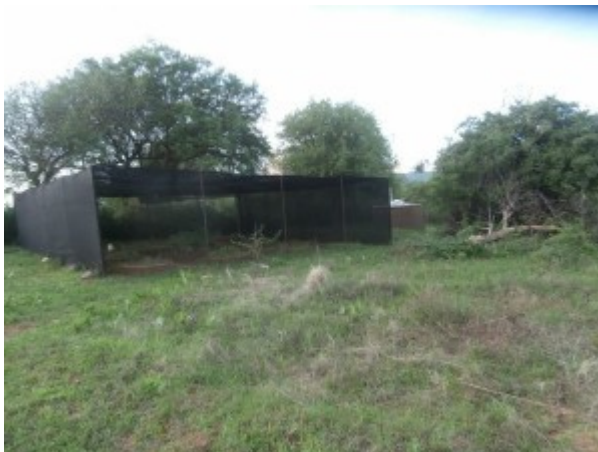
la nurseri fa il suo dovere ...