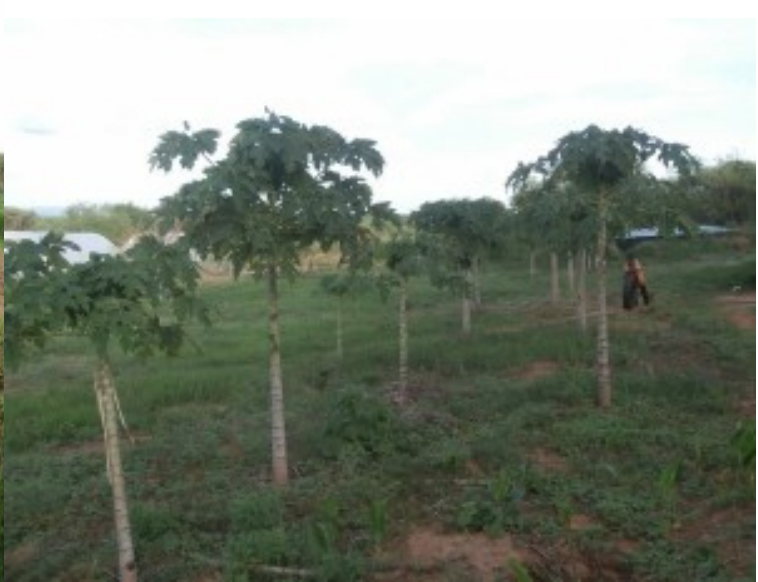
qualcosa è già in fiore ...