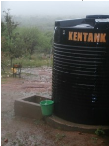
i tenks sono in sovrappieno