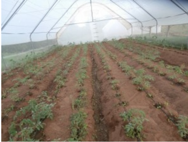
anche le serre pronte al nuovo via ...