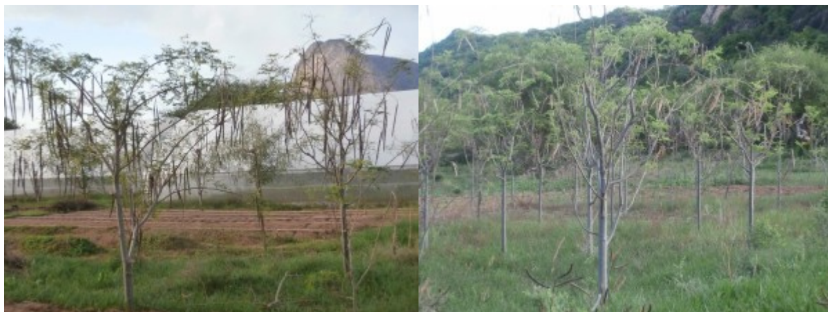
il boschetto di moringa ... stenta ma va avanti ... incrociando le dita, diverrà un bosco ...