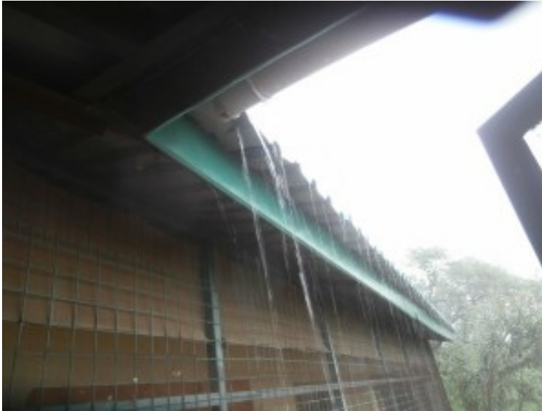
Finalmente piove come si deve ...

Con le piogge la Unit Farm riparte alla grande.