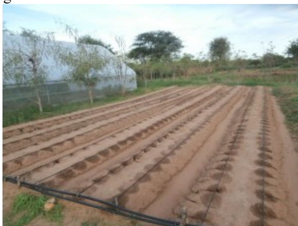
pronti al via i campi esterni