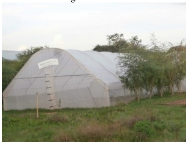
specie quelle lungo le serre ove l'acqua ristagna più a lungo