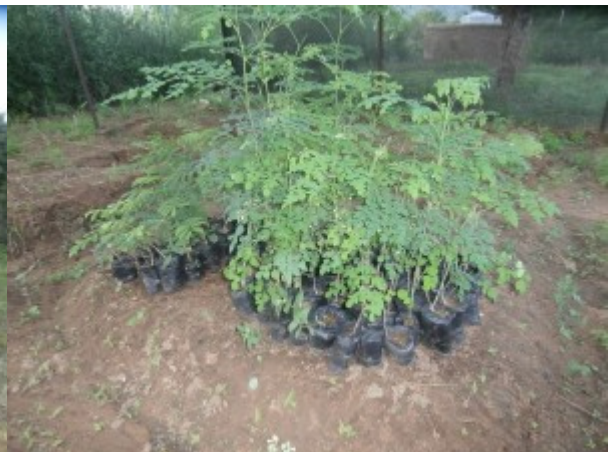
moringhe pronte per essere piantate ...