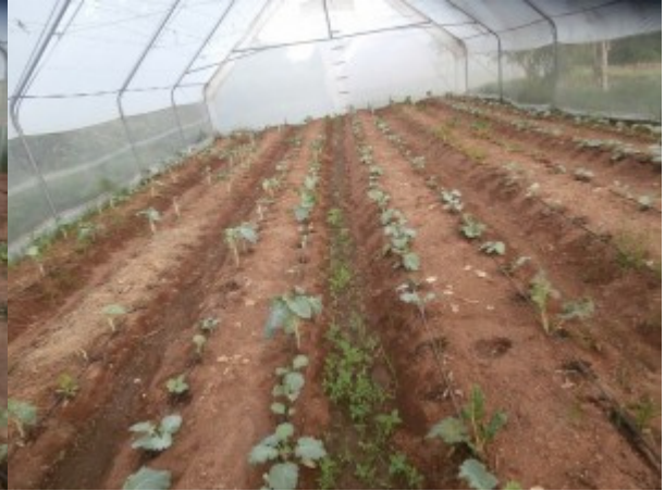
... sono partite ...