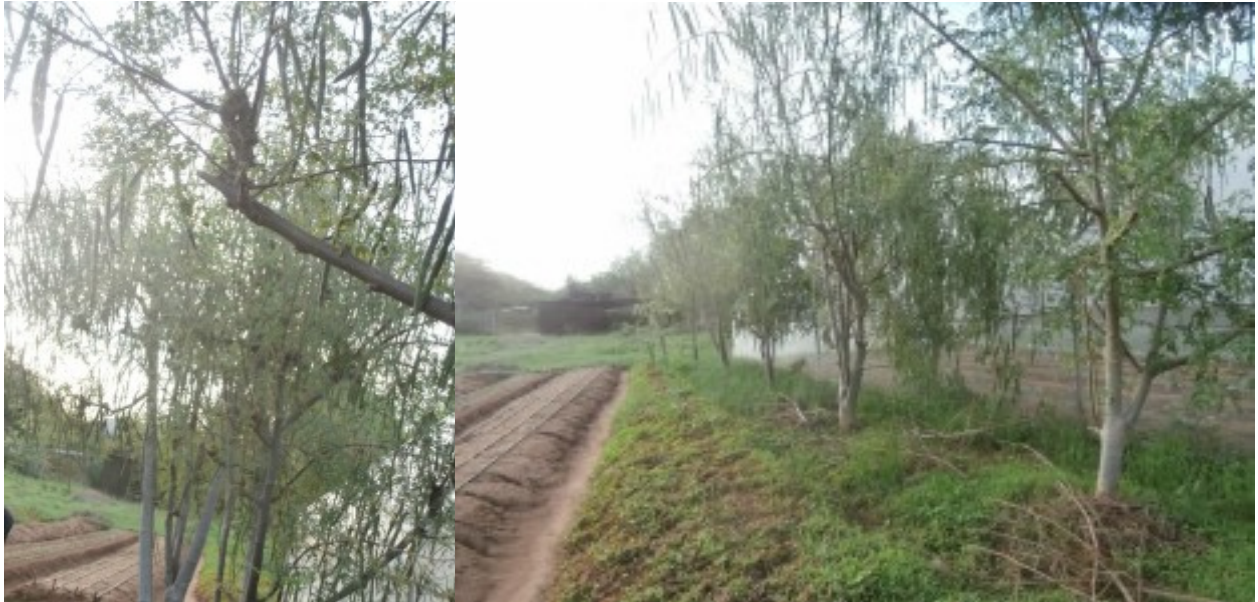
le moringhe crescono bene ...