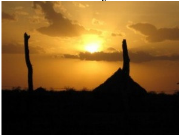
... con calore