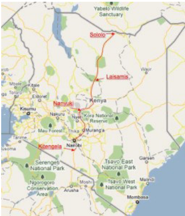
da Nairobi a Sololo