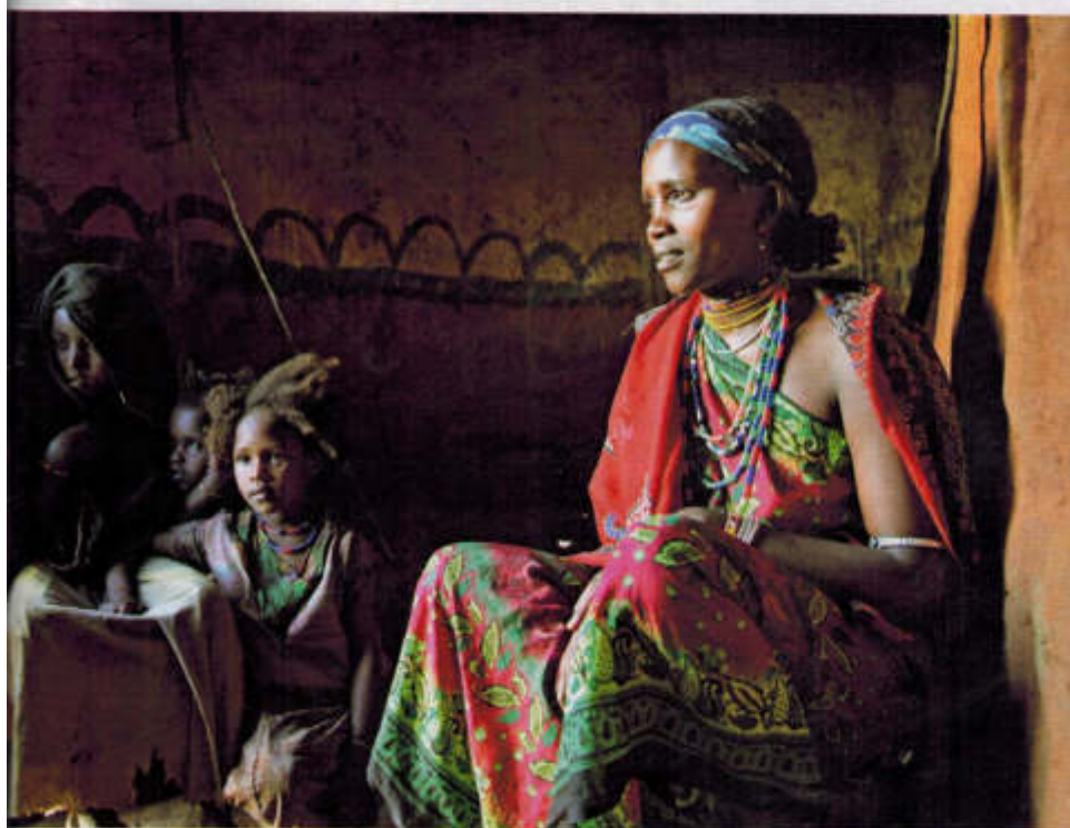
Burro. Donna con bambini, a Darito. Tra le attività delle donne, fare il burro e venderlo al mercato.

quando si discute. E, alla fine, l'importante è restaurare i buoni rapporti