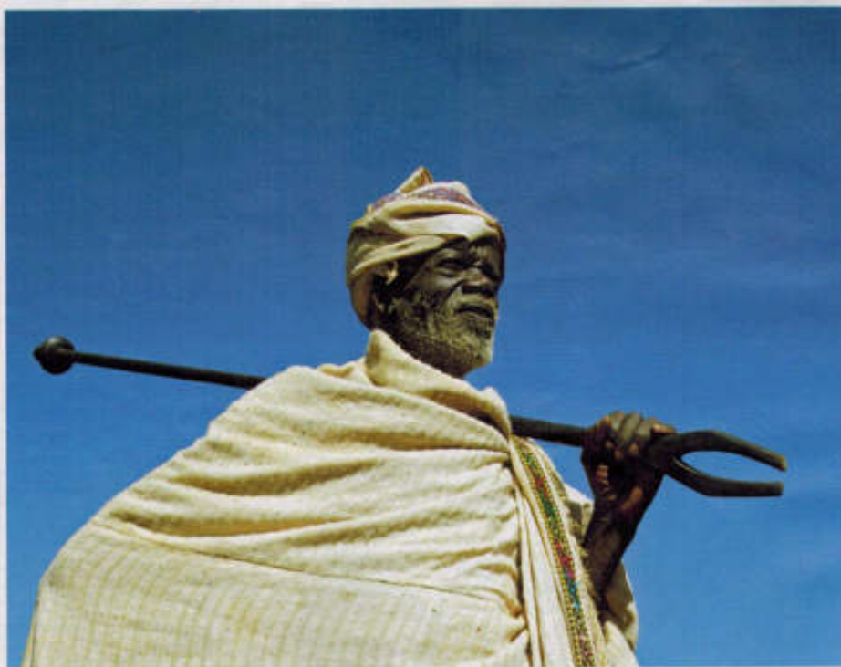
Saggio. Un anziano con l'orooro, bastone cerimoniale usato da leader e moderatori nelle assemblee.

Catena umana. Ci sono assemblee di villaggio, di clan e tra clan diversi, per decidere sui pascoli o sulla gestione dei pozzi: questi, per esempio, sono vere opere pubbliche che presuppongono una forte collaborazione generale. La costruzione richiede scavi profondi e una particolare architettura a gradini per consentire a una catena umana di passare i secchi d'acqua: si chiamano "pozzi cantanti" perché i secchi vengono pas-